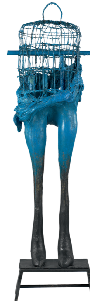
Můj stín II, 1964–1965, Zbierka Linea My Shadow II, 1964–1965, Linea Collection